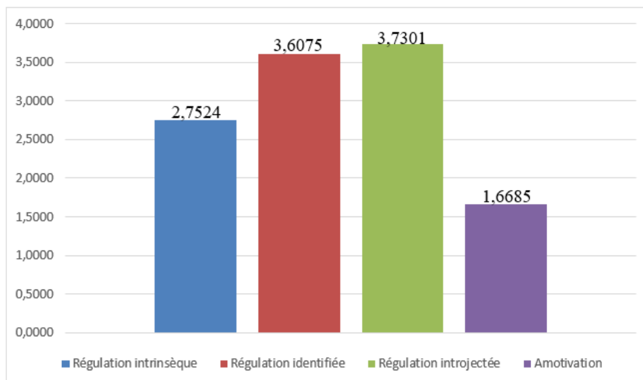
Figure 4. La mesure moyenne des types de régulation

En ce qui concerne les résultats obtenus au moyen de l'É.M.É. ainsi que des sections que nous avons ajoutées à celui-ci, il est possible de remarquer que le type de régulation sur lequel s'appuie le plus souvent les actions des élèves face à l'école, à sa perception de soi et aux mathématiques est la régulation introjectée, suivie par celle identifiée, celle intrinsèque, puis par l'amotivation. Cela indique que le plus souvent, les élèves agissent sous contraintes et non librement (contrairement à la motivation identifiée et intrinsèque). On pourrait, par exemple, penser que les élèves adoptent relativement souvent des comportements pour plaire à l'adulte. Il serait également plus rare qu'ils adoptent un comportement sans en être capable de déterminer ce qu'il lui apporte.